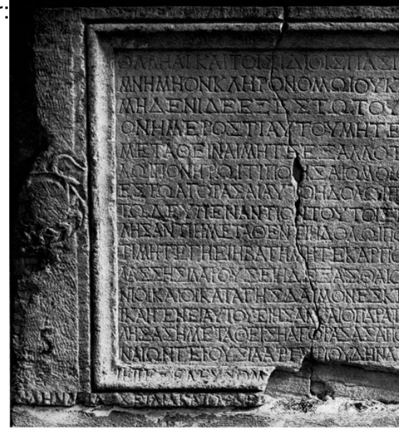
M.S. 2. yüzyılda Smyrna'da yazılan Grekçe mezar yazıtı. Taşın sağ alt köşesinde bulunan kekikçi motifi ile "kekikçi" ifadesi yer almaktadır. Robert, BCH 101, 1977, s. 5

XIX. yüzyıl sonlarında İzmir'de bulunarak Oxford Ashmolean Museum'a taşınan bir mezar taşının kekik otu ile yakından ilişkili birine ait olduğu anlaşılmaktadır. Bu taşın üzerinde, son iki satırı kısmen tahrip olmuş olan ve M.S. 2. yüzyıla tarihlenen bir Grekçe bir mezar yazıtı yer almaktadır. Yazıtın başlangıcını oluşturan ilk satır(lar) noksan olduğundan, mezar sahibinin adını öğrenmek mümkün olamamaktadır. Yazıtın çevirisi şöyledir: